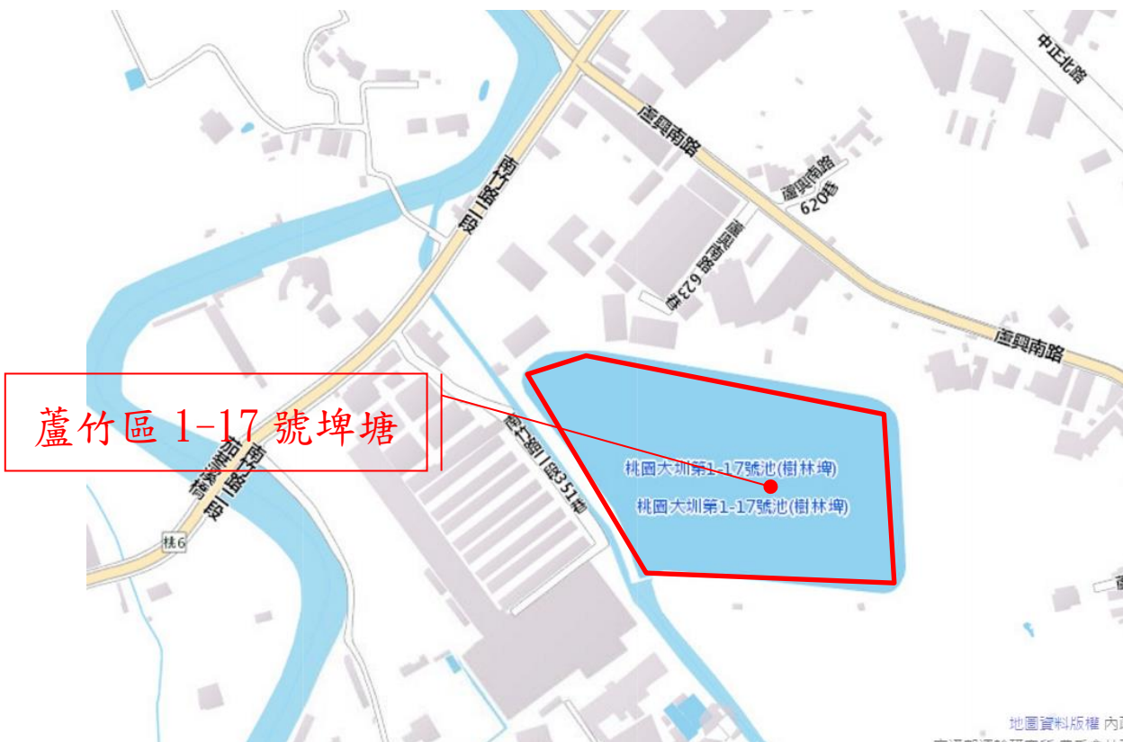
圖一 蘆竹區 1-17 號埤塘位置圖

三. 蘆竹區 2-11 號埤塘，本局將再次辦理現場會勘，訂於 106 年 3 月 24 日。