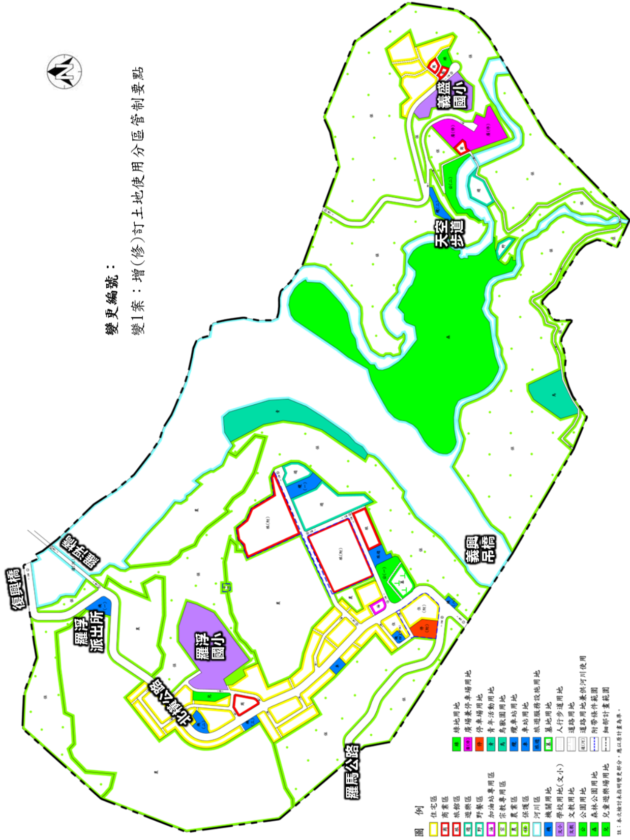
圖 2 「變更小烏來風景特定區細部計畫(第一次通盤檢討)案」變更示意圖