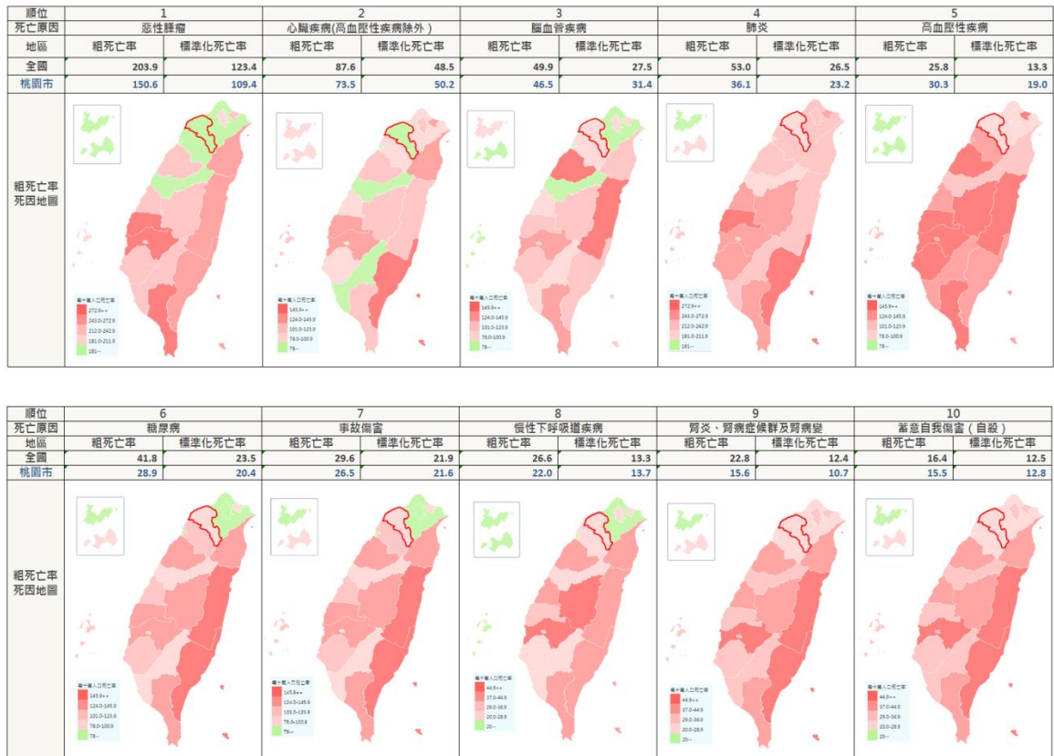
圖 1：106 年桃園市與全國十大死因粗死亡率死因地圖

若不考慮各縣市的人口結構不同下，單純以各縣市實際死亡人數相對年中總人口數的粗死亡率角度來看，本市前六大死因與全國的死因地圖如圖，其中本市惟第 5 順位死因「高血壓性疾病」的粗死亡率每十萬人口有 30.3 人高於全國粗死亡率之每十萬人口 25.8 人，增高幅度達 17.6%，其餘各項死因的粗死亡率則皆低於全國，以「肺炎」減少的幅度最大，較全國減少 31.8%，「腎炎、腎病症候群及腎病變」次之，減少為 31.5%。