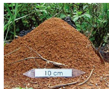
入侵紅火蟻成熟蟻巢

明顯隆起的蟻丘是最容易辨別入侵紅火蟻的方法，因為台灣約 270 種螞蟻中，沒有會築出高於地面 10 公分蟻丘的種類，蟻丘內部呈蜂巢狀結構，但需注意蟻巢初形成時並無明顯之蟻丘，易與其它種類螞蟻之蟻巢混淆。