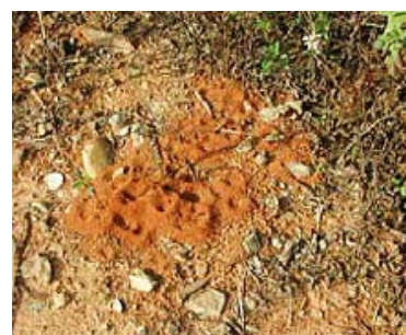
入侵紅火蟻初期蟻巢無明顯隆起