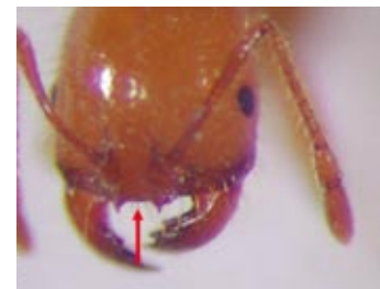
熱帶火蟻無頭楯中齒