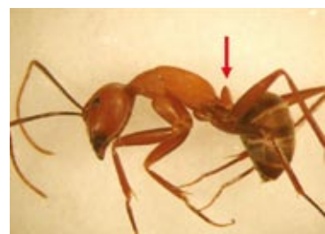
非火蟻之其它亞科螞蟻