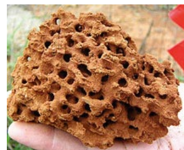
蟻巢內之蜂巢狀結構