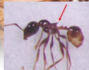
擬大頭家蟻屬有前伸腹節齒