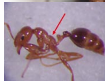
火蟻屬無前伸腹節齒