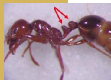
火蟻屬之家蟻亞科