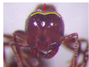
入侵紅火蟻後頭部平順無凹陷