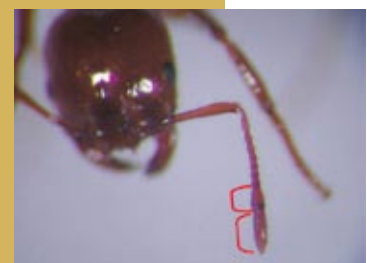
火蟻屬錘節 2 節