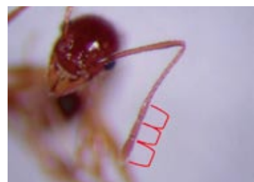
大頭家蟻屬錘節 3 節