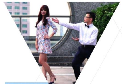
微电影「沒關係是廉政啊！」劇照

有興趣之同仁或民眾，請上本處網站搜尋「沒關係 是廉政啊！」觀看劇情。 http://cseid.tycg.gov.tw/home.jsp?id=76&parentpath=0%2C75&mcustomize=multimessage_view.jsp&dataserno=201509150025&aplistdn=ou=hotnews,ou=chinese,ou=ap_root,o=tycg,c=tw&toolsflag=