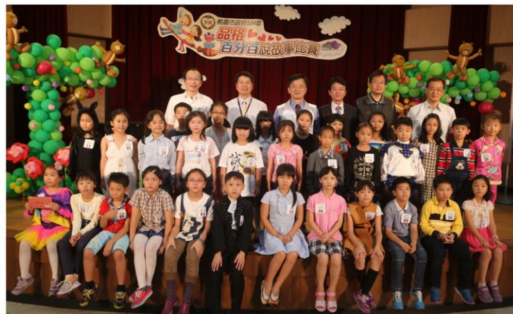
獲獎學生與現場來賓合照 ▲

臺灣桃園地方法院檢察署王襄閱主任檢察官亦鼓勵小朋友從小就積極參與競賽活動，勉勵學童培養誠實信用的道德觀，長大後自然能守法，具備良好的品德教育才是鞏固廉潔政府的基石。