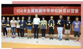
研習營傑出學員授獎

遺憾的是因蘇迪勒颱風影響，為顧及學員們返鄉安全，營隊提前半天結束，相信這次誠信營活動已帶給學員團體生活上不一樣的體悟及深刻友誼，亦能感受政風人員的真誠服務，期待明年的活動能更加精采。