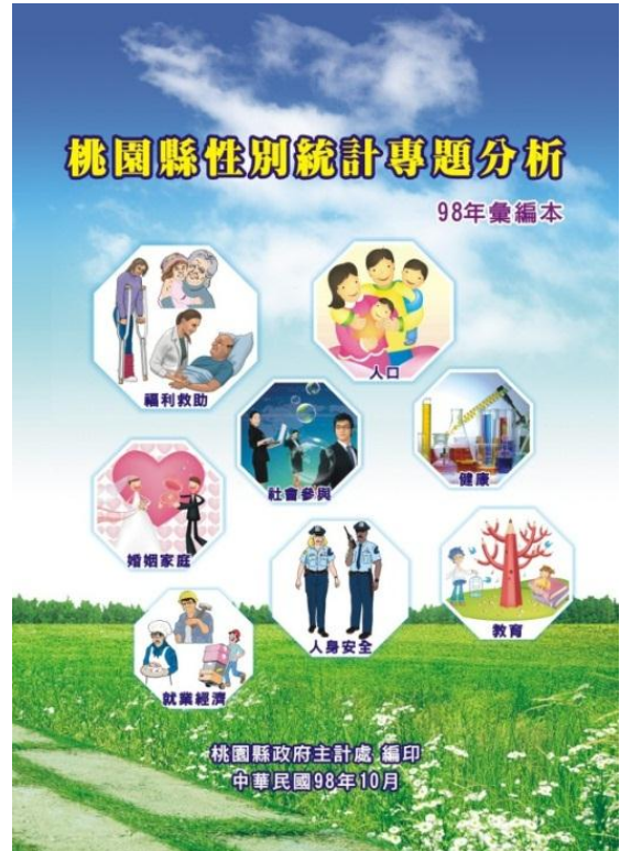
「桃園縣性別統計專題分析-98 年彙編本」封面

(二) 2009 年 5 月「桃園縣性別統計專題分析」：依本縣性別指標架構之 8 大面向，呈現本縣兩性之人口結構、婚姻家庭、福利救助、教育、就業、社會政治參與、人身安全與健康之性別統計資訊。