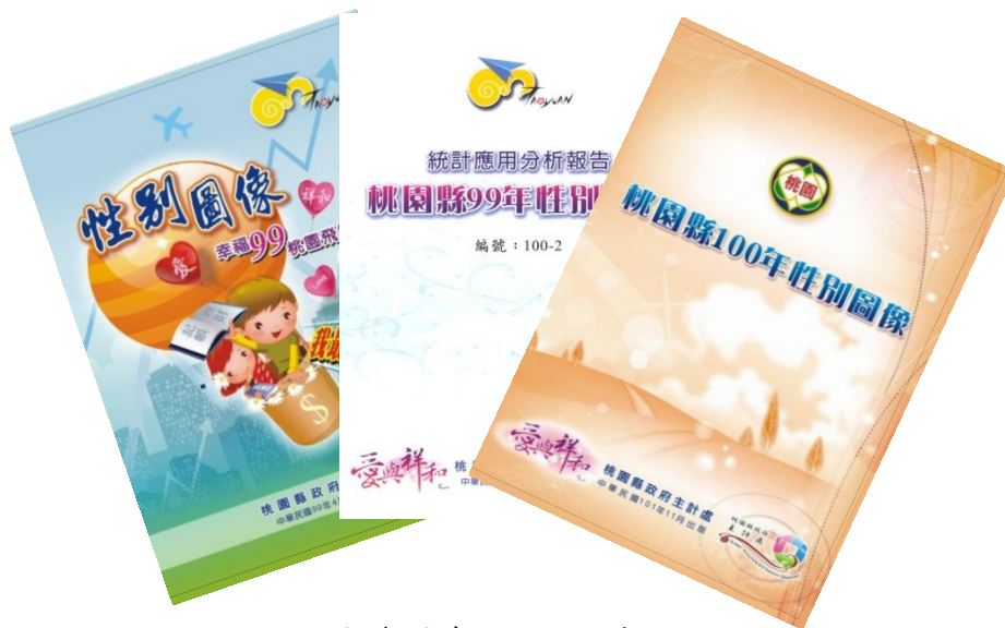
桃園縣歷年性別圖像封面

本處就第 2 階段性別統計指標之 8 大面向 37 項性別統計指標，參考行政院主計總處性別圖像，於 2010 年創編「桃園縣 98 年性別圖像」，當時全國縣市中僅高雄市政府編有性別圖像，並逐年修訂指標項目，按年刊印且上載網頁以供各界參用。