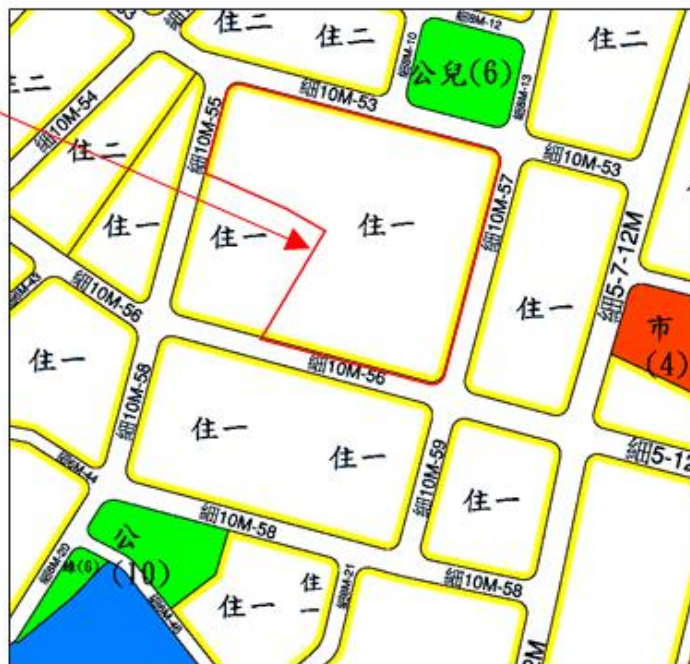
本案變更基地位置示意圖