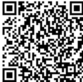
桃園市政府都市發展局 Youtube QRcode

本計畫公展草案內容、陳情意見表及現場直播，請掃描左方 QRcode 或至桃園市政府都市發展局網站，網址： https://urdb.tycg.gov.tw/ 。