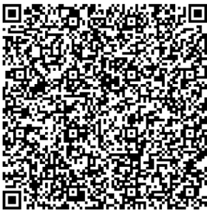
桃園市政府都市發展局 網站 QRcode