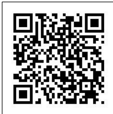
楊梅戶政 facebook 粉絲專頁