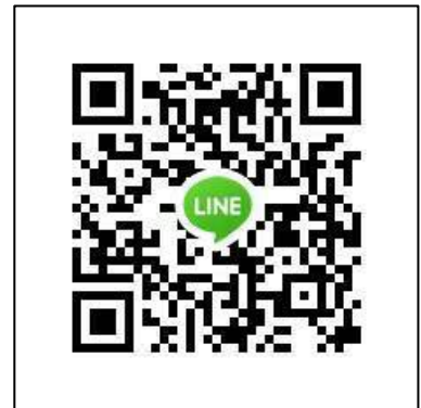
楊梅戶政 LINE 線上諮詢