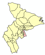
桃園市蘆竹區南崁里