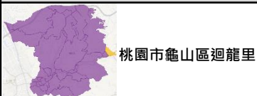
桃園市龜山區迴龍里