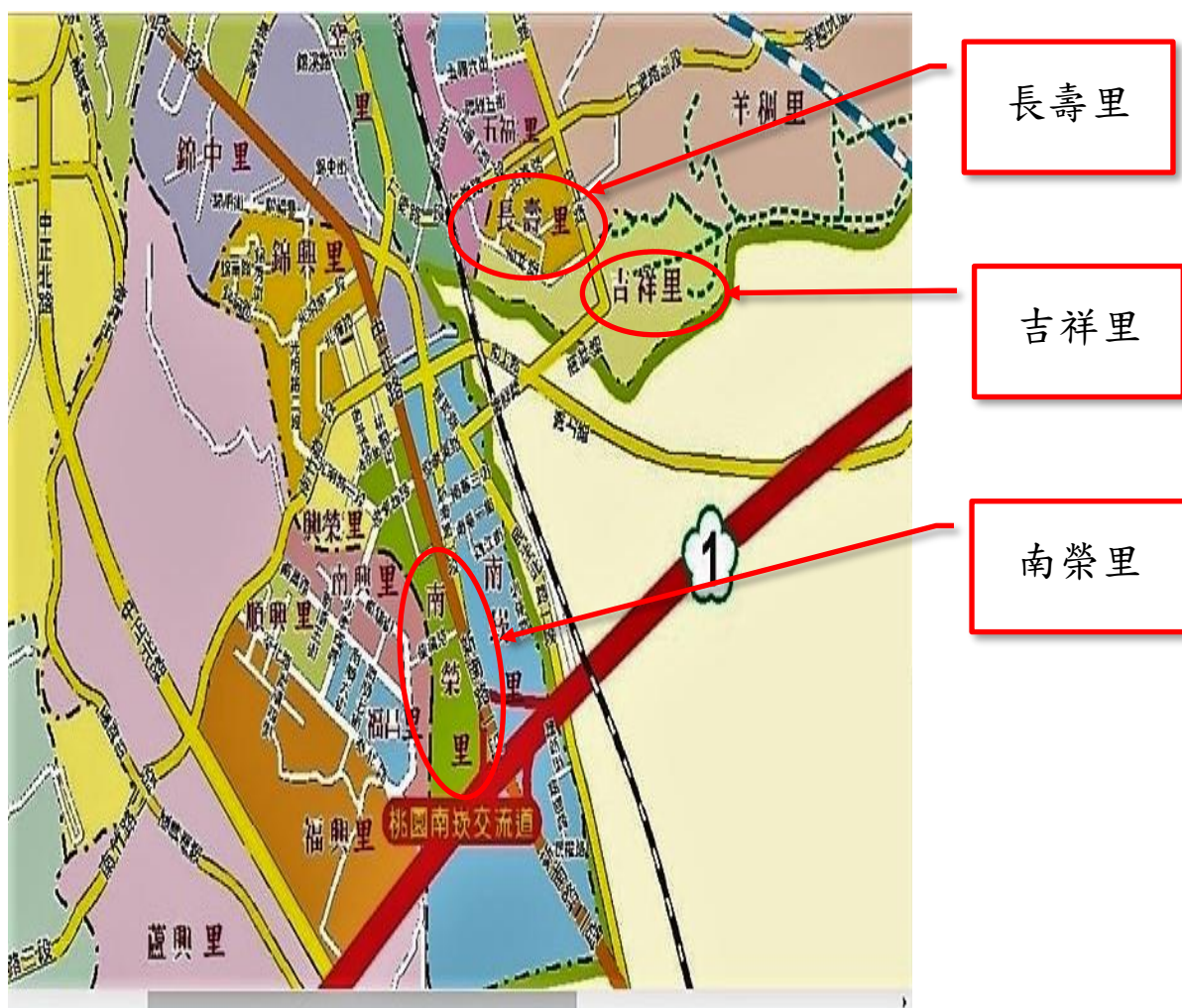
圖 1：本計畫實施範圍之行政區域位置關係圖

本計畫實施對象則以上開社區自願擔任志工者為培訓對象。至志工培訓人數，本區已設計「提升社區志工關懷高齡老人之專業技能培訓計畫~志工培訓意願調查表~(請參閱附件 1)」進行調查。