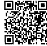
桃園市公立及非營利幼兒園 招生系統