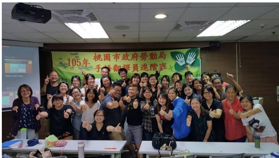
聾人文化分享課程