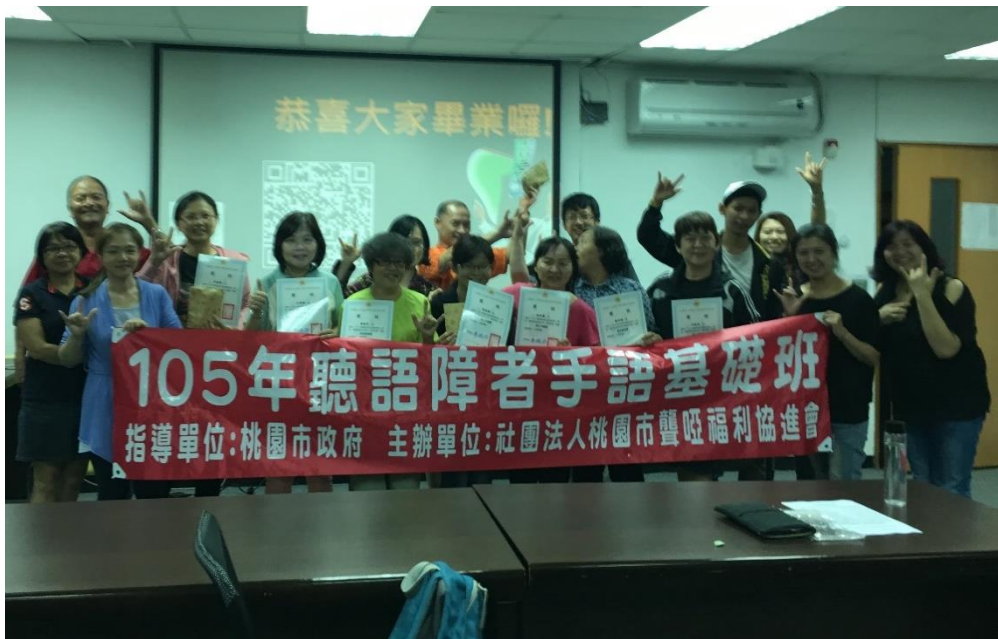
辦理聽障手語班中聾聽學員融合教學